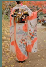
여성이 입는 기모노 ‘후리소데’