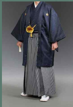
남성이 입는 기모노 ‘키나가시’